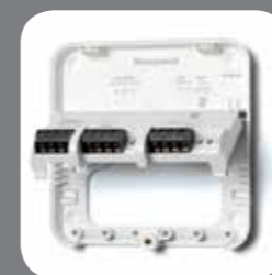
Placa de montaje del receptor